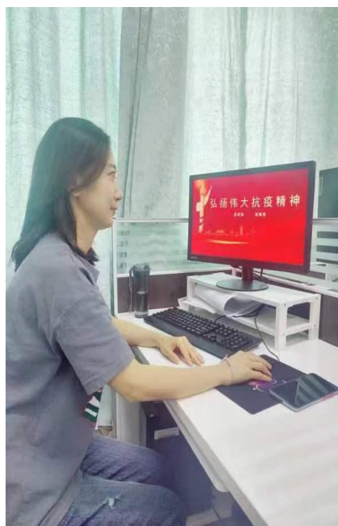
思政部教师开展线上集体备课