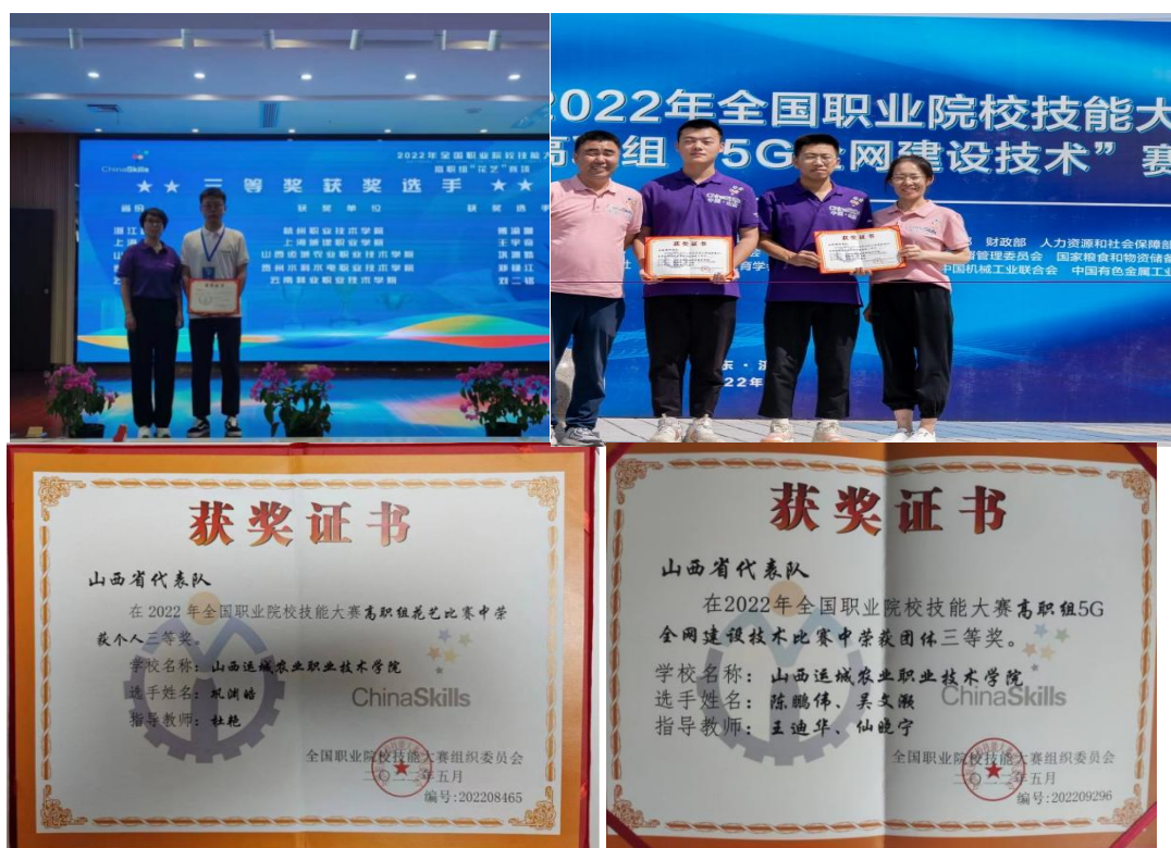
图 1-4 2022 年国赛获奖证书