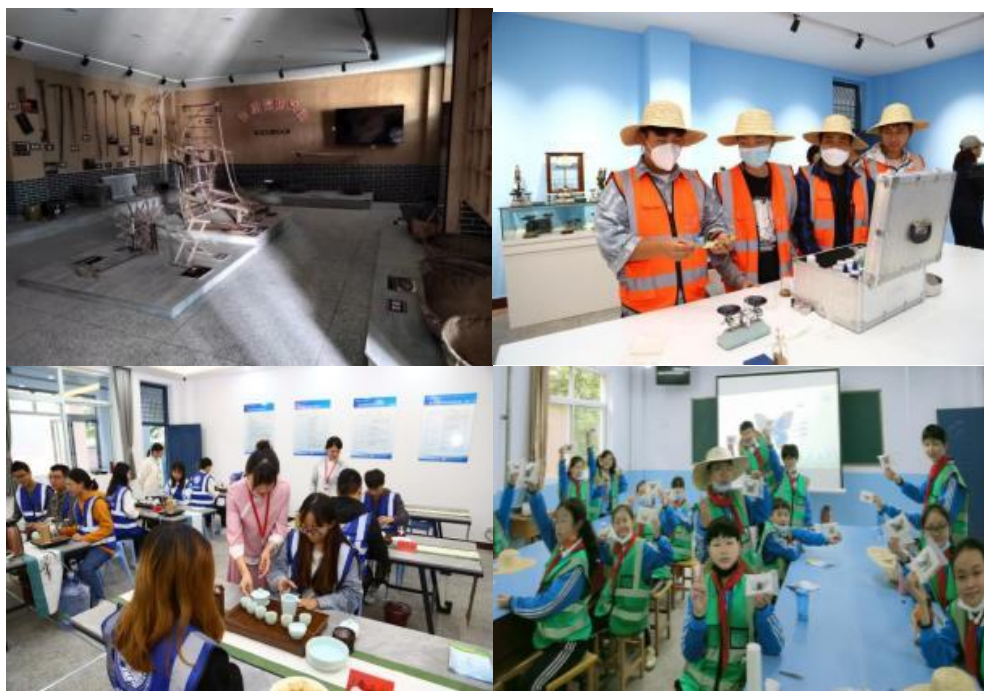
图 4-8 研学基地

学院所筹建的运城市中小学研学实践基地已在学院实习农场开营，其中包括农耕文化馆、农业科技馆、农耕体验馆等多个农耕文化场馆。目前学院申请的省级研学实践基地和劳动教育实践基地已经申报。