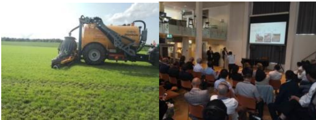
图 3-2 参与畜禽废弃物还田标准国际校企合作交流研讨