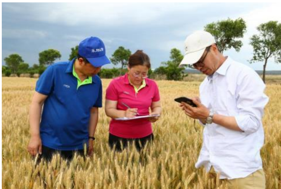
图 4-7 学院教师赴垣曲进行优质小麦测产

原则，引进袁氏种业北方水稻试栽实验、半夏、菊花、玫瑰等药茶种植及综合利用、冬枣新品种示范、优质专用小麦综合配套技术等项目，作为农业新技术、新品种、新工艺、新标准示范展示基地，提升区域经济社会内农业产业升级发展。同时，配套引黄灌溉工程，面向新技术、新产业、新业态、新模式，强化产业引领，培育无人机植保技术及相关产业链，培育智慧农业技术及相关产业链，努力打造集“学生实习实训、农技推广、现代农业示范、农业科研、创新创业孵化、农业休闲观光、运城市中小学研学教育”七位一体的高标准现代化千亩实习农场。