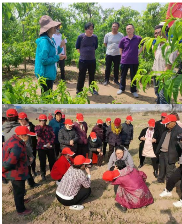
图 4-1 服务“三农”掠影

学院依托校内教学资源、校外实习实训基地资源以及依托校企合作平台，围绕加大社会服务和社会贡献，面向终身学习型社会构建、技术技能型人才培养、农村劳动力转移培训、技术培训与推广、经济社会转型发展等社会需求，按照“人人持证、技能社会”总体发展思路，坚持育训结合、长短结合、内外结合的原则，积极面向在校生和全体社会成员，开展职业技能提升培训，使更多劳动者实现技能就业、技能增收、技能成才。通过不断提升学院的社会服务能力，加大社会贡献力度，积极开展多项社会服务活动，有效支持乡村振兴战略，为区域经济社会发展服务，为社会培养更多的高素质农民，不断提高学院的品牌效应，提高社会的认可度和满意度（见图 4-1）。