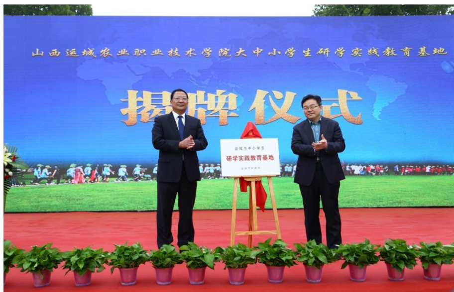
图 1-1 研学基地揭牌仪式

2022 年学院在各专业课程体系中全面植入《耕读教育》课程，并成立“耕读工作室”，融入劳动情怀，传承农耕文化；通过四史、形势与政策、习近平新时代中国特色社会主义思想等思政课程，传承中华优秀传统文化，厚植爱国传统和文化；加强典型教育，大力宣传张富清、黄大发、黄文秀等一大批重大典型先进事迹，广泛开展“学习身边榜样”活动，引导广大师生学习身边先进、争做先锋，形成示范引领效应。运城市中小学研学实践基地已在学院实习农场开营，包括农耕文化馆、农业科技馆、农耕体验馆等多个农耕文化场馆，目前省级研学实践基地和劳动教育实践基地已经申报。