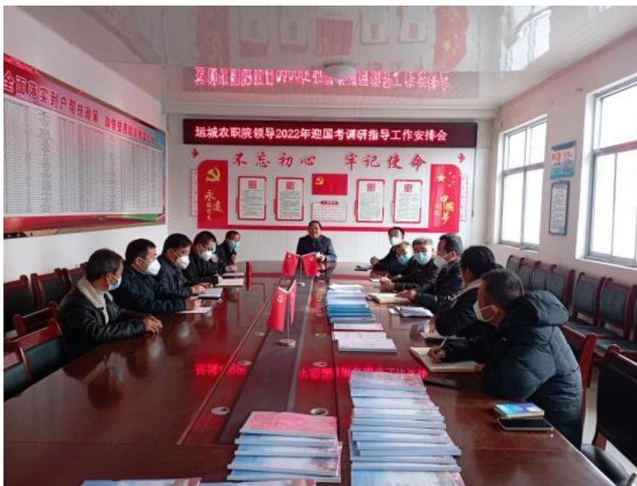
图 4-5 2022 年学院党委班子成员赴村调研指导

我院是垣曲县古城镇圪塔村和硖口村的对口帮扶单位，为扎实推进巩固拓展脱贫攻坚成果同乡村振兴有效衔接工作。学院在两个村各派驻一支工作队，共 6 名同志，长期驻村。学院党委高度重视驻村帮扶工作，2022 年先后 6 次入村调研指导或慰问村民（图 4-5）。