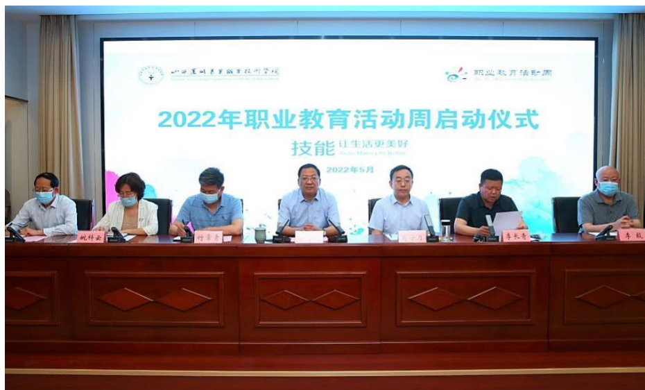
图 1-3 2022 年职业教育活动周启动仪式

德树人，关爱学生，从严治校，让文化领跑办学，传承办学文化，从“感恩责任”和“砺志成才”的文化中汲取养分，领悟“感恩”文化的“德”和“砺志”文化的“行”，形成本校的“德行”文化，进而通过激发学生的学习兴趣、增强学生学习信心、构建多样课余生活等方面来丰富学生的学习生活体验。学生对教师教学满意度达 96.3%，学校风气满意度达 97.6%，实习实训满意度达 92.5%，校园文化与社团活动满意度达 92.4%，生活满意度达 90.5%，校园安全满意度达 99.2%。