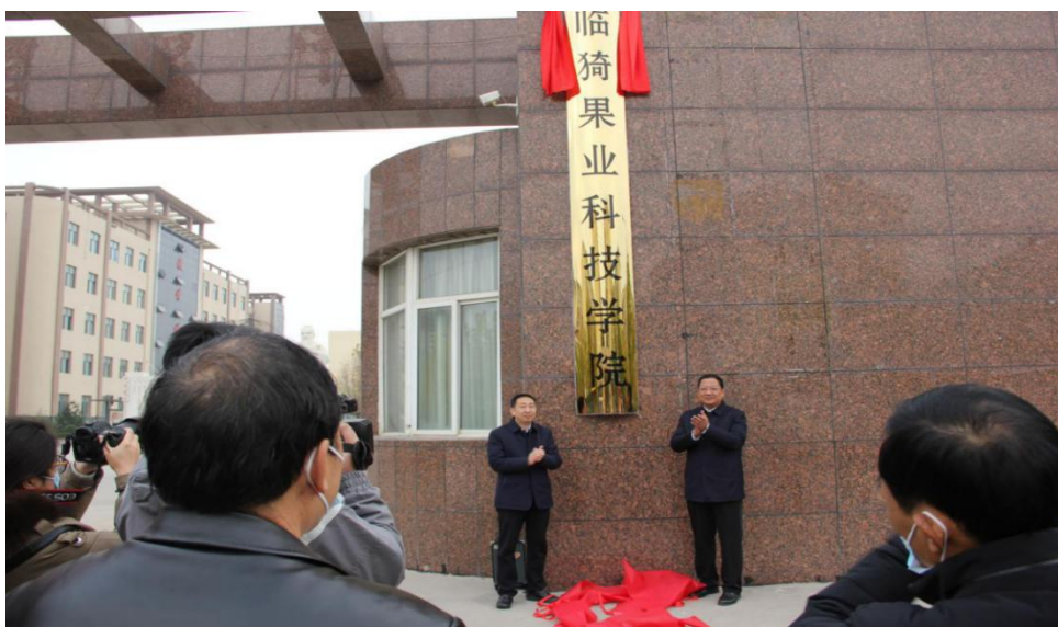
图 4-9 与临猗县政府共建临猗果业科技学院