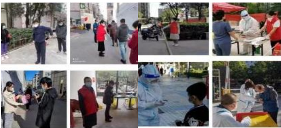
图 4-6 学院教师参与社区疫情防控

学院利用教育资源优势，积极调动党员教师和学生志愿者深入社区，与社区开展结对共建服务，组织所属党员就近在居住地社区报到，积极参加社区组织的政策宣传、疫情防控等工作。在疫情防控的关键时期，学院组织党员志愿者积极投身疫情防控“大战”，为社区居民做好网格员、疫情志愿者的工作等，主动引导群众排队做核酸、配合采样的医护人员完成核酸采集工作、帮助社区居民定菜配送等，用行动诠释着使命，彰显着担当。