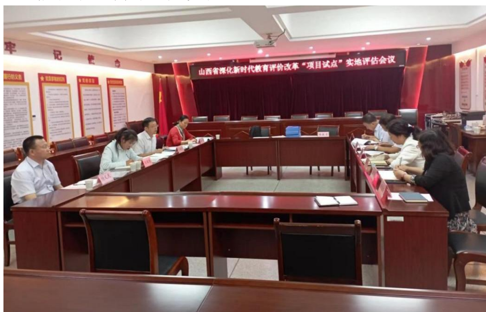
图 4-13 迎接山西省深化教育新时代教育评价改革试点验收

2021 年 6 月，学院申报了《山西省深化新时代教育评价改革项目试点》——“坚持把师德师风作为第一标准”。2021 年 8 月立项，建设期限一年。2022 年 7 月 24 日，学院上报“项目试点”验收报告材料，9 月 21 日，山西省深化新时代教育评价改革试点实地评估组来我院评估验收，并顺利通过。