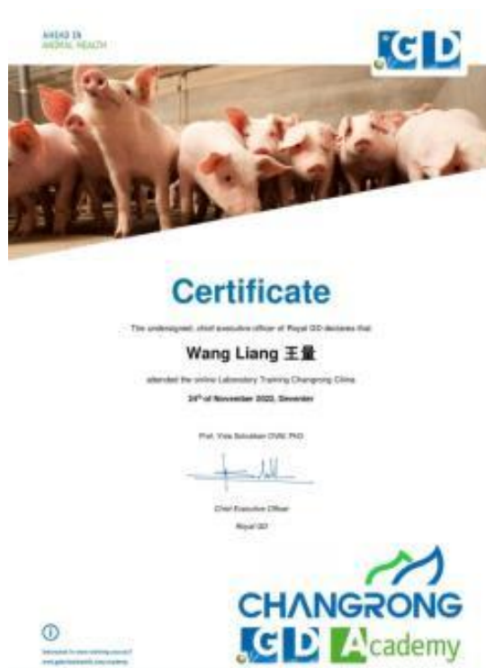
图 3-4 培训证书