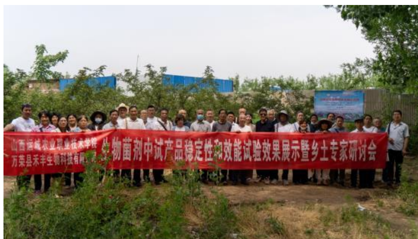
图 4-2 生物菌剂中试产品稳定性和效能试验效果展示暨乡土专家研讨会

我院中量元素水溶肥料示范试验中心和万荣县禾丰生物科技有限公司共同研发的生物菌剂，已在平陆、垣曲、永济、夏县、临猗等县，开展花椒、葡萄、核桃、西红柿、黄瓜、西瓜、梨树、冬枣、桃树等作物试验，作物品质提升明显，2022 年 5 月 27 日在芮城县阳城镇共同举办了生物菌剂中试产品稳定性和效能试验效果展示暨乡土专家研讨会（图 4-2）。