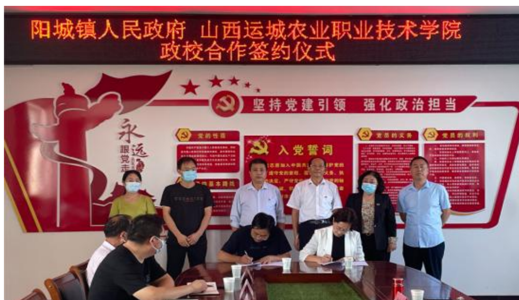
图 4-12 与阳城镇政府签署政校合作协议