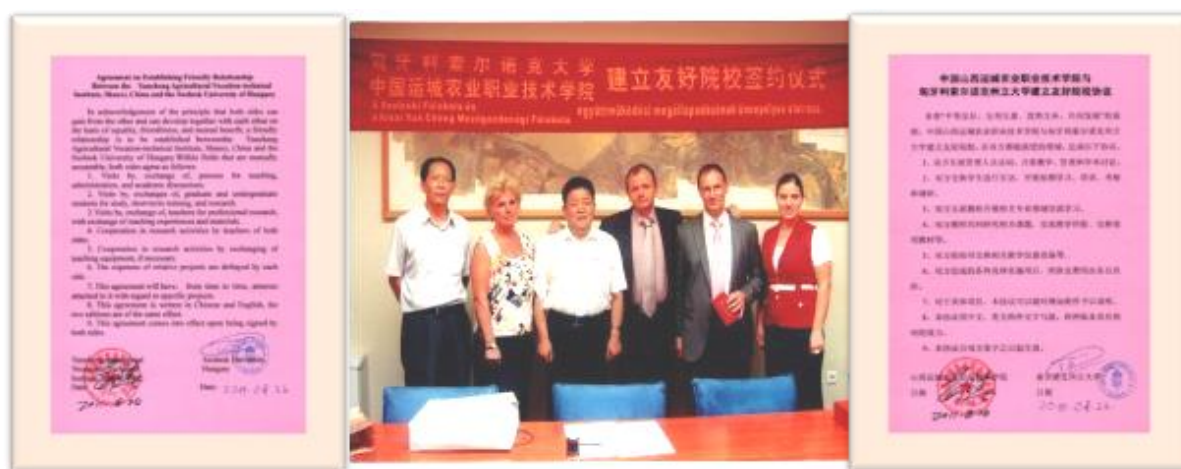
图 3-1 学院与匈牙利索尔诺克州立大学开展国际交流合作

2011 年学院与匈牙利索尔诺克州立大学签订友好院校协议，本着“平等友好、互利互惠、优势互补、共同发展”的原则，双方互派教师开展相关专业领域交流学习，共同进行课题研究与项目开发，互换学生进行短期学习、培训（图 3-1）。