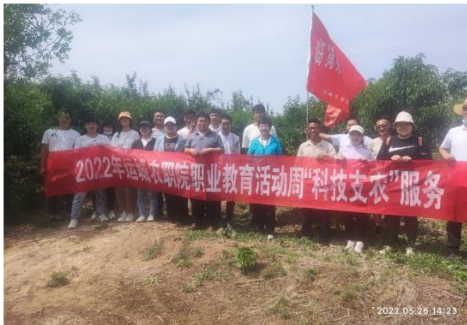
图 4-4 学院教师开展科技支农服务

了积极贡献，为助推区域经济社会产业转型升级、转型发展，促进社会就业和脱贫致富起到了不可替代的作用（图 4-4）。